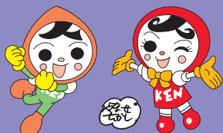
人権イメージキャラクター 人KENまるもる君 人KENあゆみちゃん